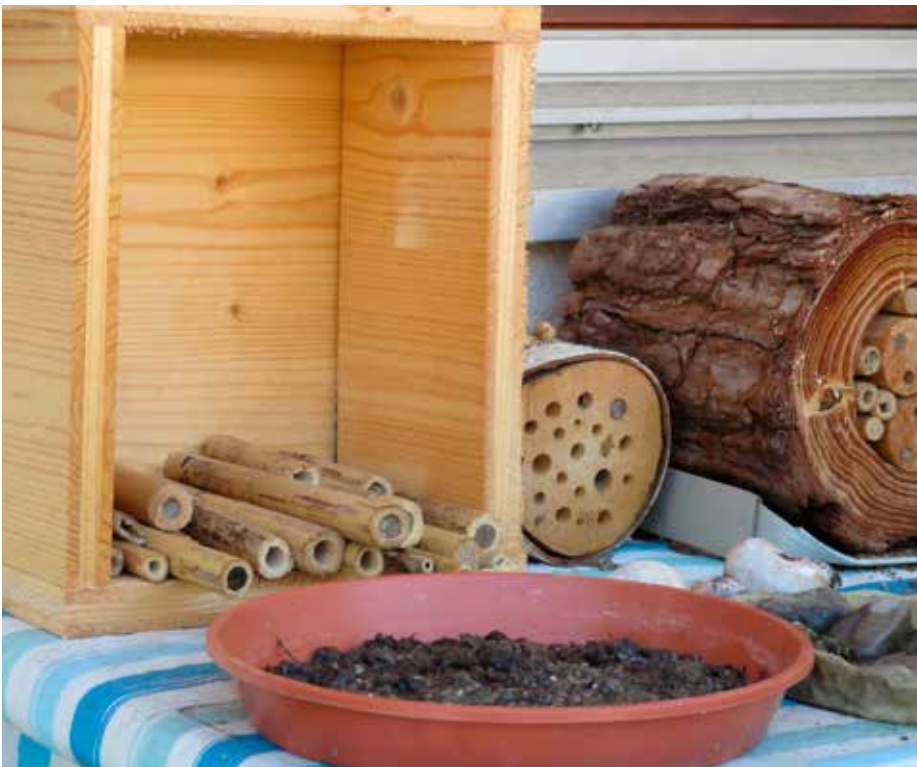
Kastengestell mit zurechtgesägten Bambusröhren und kleiner Blumenuntersetzer mit Lehm-Sandmischung zum Verschließen der Brutzellen

Natürlich Sorge ich auf meinem Balkon auch für ein möglichst ergiebiges Nahrungsangebot. Salbei, Oregano, Lavendel, Kapuzinerkresse, Bienenfreund, Kornblume reihen sich neben einer vom Spätwinter bis in die letzten Herbsttage wechselnden Fülle anderer Wiesen-, Feld- und Gartenblumen in meinen Töpfen und den beiden Hochbeeten. So kamen lange nach der Flugzeit der Wildbienen auch Honigbienen, Hummeln, Schwebfliegen, kleine Wespen und Schmetterlinge zu Besuch. Zwei Trinkschälchen mit Sitzsteinen stehen bereit, und schließlich habe ich einen kleinen Blumenuntersetzer mit einer Lehm-Sandmischung gefüllt, die ich regelmäßig feucht gehalten habe. Sie sollte die bei mir tätigen Mauerbienen mit Material für die Verschlüsse ihrer Brutzellen versorgen – ähnlich einer Schwalbenpfütze. Mit relativ wenig Aufwand lässt sich aus einem Balkon ein kleiner Stützpunkt für die Artenvielfalt an Wildbienen im Siedlungsraum einrichten. Probiert es aus!