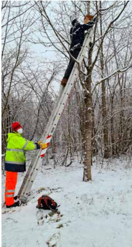
Neue Starenkäste werden angebracht.

Unsere LBV-Kreisgruppe betreut mittlerweile über 100 Vogel- und Fledermauskästen. Angefangen bei kleinen Meisennistkästen über Eulennistkästen und Übertagungsquartiere für Fledermäuse, bis hin zu über 30 kg schweren Fledermausüberwinterungskästen, ist für viele geflügelte Gäste etwas dabei.