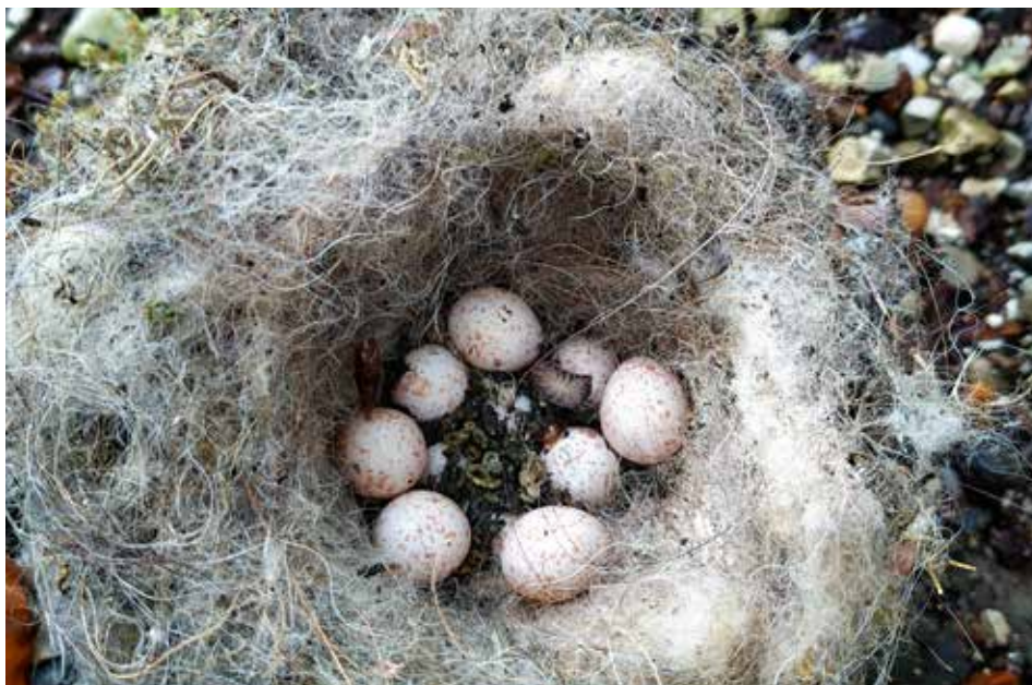
Hier ist die komplette Brut misslungen!

Während der Brutsaison werden die Kästen durch fleißige Nestbauer fast bis zur Hälfte mit Nistmaterial gefüllt. Im Nistmaterial sammelt sich aber auch Schmutz an und Parasiten wie Vogelflöhe oder Milben fühlen sich darin wohl. Deshalb werden im Herbst die Kästen geöffnet und das alte Nistmaterial wird entfernt, so entsteht wieder Platz für den Neuanfang im nächsten Frühjahr. Gelegentlich findet sich dabei auch Unerwartetes: Hin und wieder misslingt eine Brut und das ganze Gelege ist noch im Kasten.