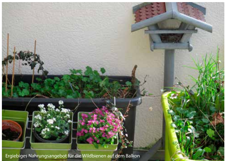
Ergiebiges Nahrungsangebot für die Wildbienen auf dem Balkon

Vor Wohnraum- und Küchenfenstern kann ich natürlich nur die häufigeren, weniger anspruchsvollen und noch ungefährdeten Arten dieser sämtlich solitär lebenden Bestäuber fördern. Zu diesen gehören die Gehörnte und die Rote Mauerbiene, deren Larven seit einigen Jahren in Brutröhren auf meinem Balkon heranwachsen und im jeweils folgenden Frühjahr in ihr wenige Wochen kurzes Leben als Fluginsekten schlüpfen. Aber auch wenn Bienenhäuser, Bienenhölzer oder Brutröhren aus durchgesägten Bambusröhren keine gefährdeten Arten auf den Balkon locken, leisten die bereitgestellten Hilfsmaßnahmen sicherlich einen wertvollen Beitrag zum Artenschutz im Siedlungsraum und helfen, die Bestäubungsleistungen für die umliegenden Gärten sowie die weitere Landschaft zu gewährleisten. Manchmal stelle ich mir vor, wie bepflanzte und mit Bienennisthilfen ausgestattete Balkone Obstbauern und Imker unterstützen. Wie das?