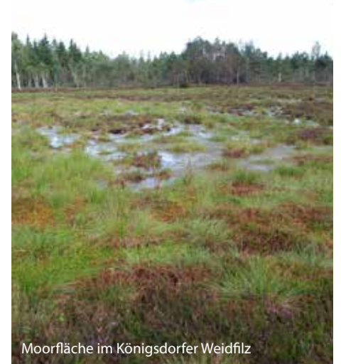
Moorfläche im Königsdorfer Weidfilz

Dieses 250 ha große Mooregebiet ist in ca. 300 Grundstücke aufgeteilt. Nach und nach kaufen wir hier Grundstücke, um zusammen mit weiteren Eigentümern Flächen wieder vernässen zu können.