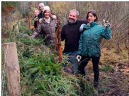
Viel Spaß bei der ungewohnten Arbeit

Nach Vorarbeiten unserer Kettensäger aus der Biotoppflege Gruppe räumten 12 Astra Zeneka Mitarbeiter abgeschnittene Äste vieler