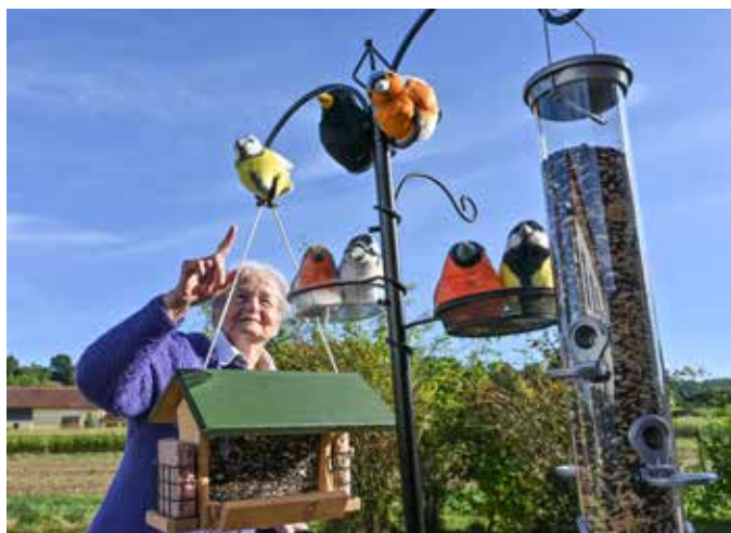
Bald kommen die echten Vögel an die Futterstation