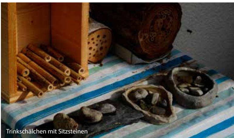
Trinkschälchen mit Sitzsteinen