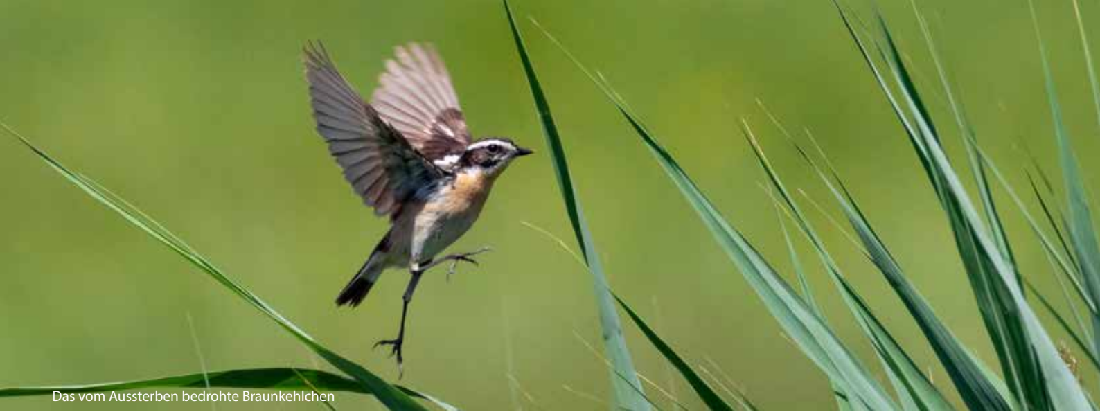
Das vom Aussterben bedrohte Braunkehlchen