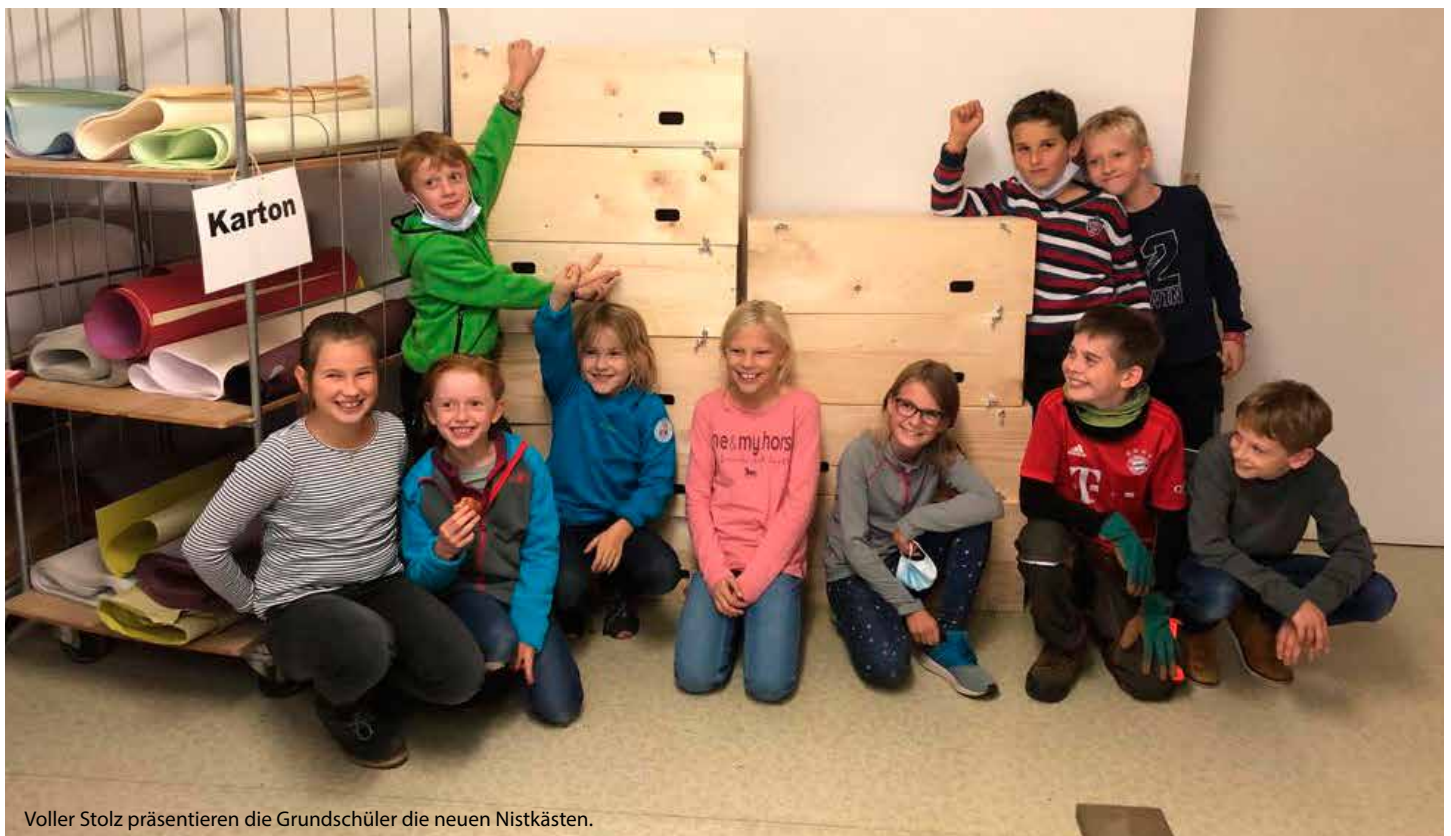
Voller Stolz präsentieren die Grundschüler die neuen Nistkästen.