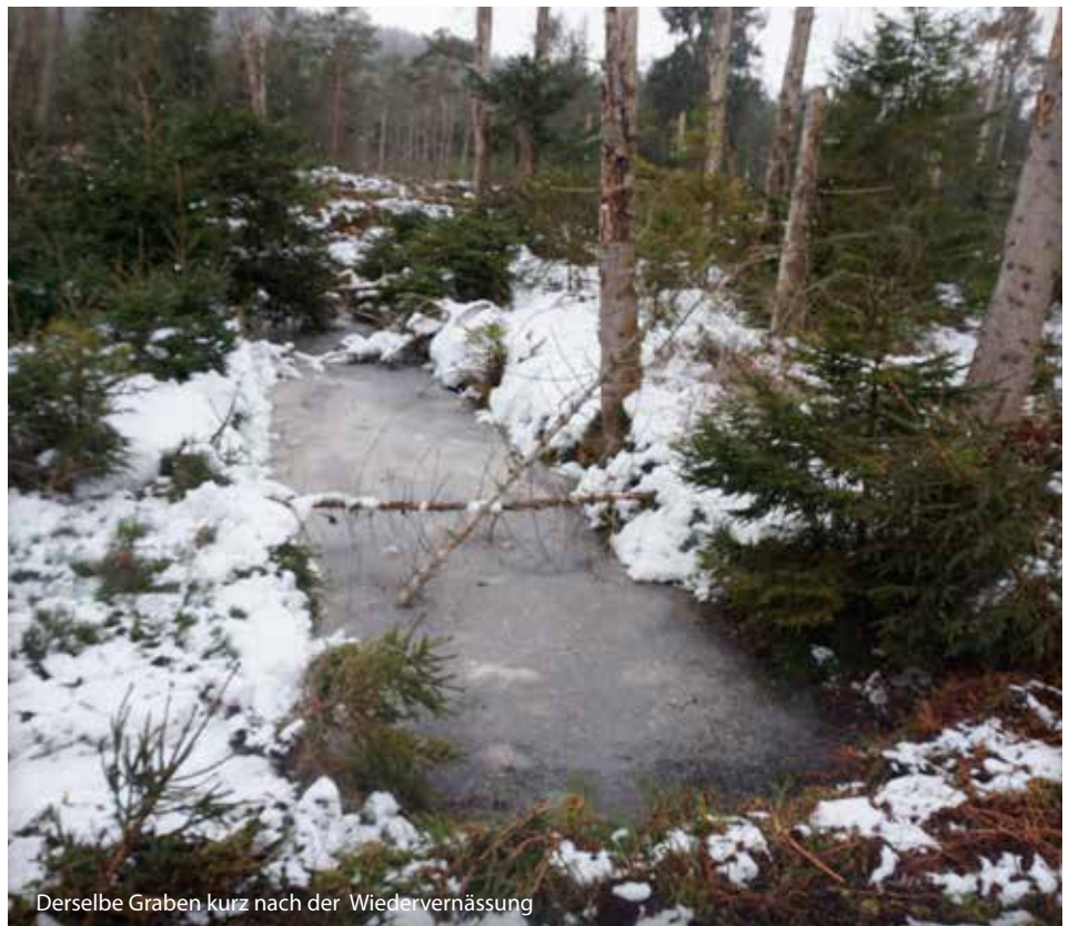
Derselbe Graben kurz nach der Wiedervernässung