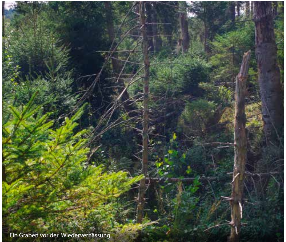
Ein Graben vor der Wiedervernässung

Das 130 Hektar große Naturschutzgebiet Zellbachtal ist das jüngste Naturschutzgebiet im Landkreis: Bereits nach dem 2. Weltkrieg angestrebt, wurde es – unter dem Eindruck der Planung 1993, eine Kreismülldeponie im Tal zu installieren – 2002 als Naturschutzgebiet (NSG) ausgewiesen. Knapp 100 bedrohte Arten der Roten Liste Bayern konnten im Gebiet nachgewiesen werden. Zu den stark gefährdeten Arten zählen Lungenenzian sowie die Schmetterlinge Goldener Scheckenfalter und Enzian-Ameisenbläuling. Auch ein kleiner Be-