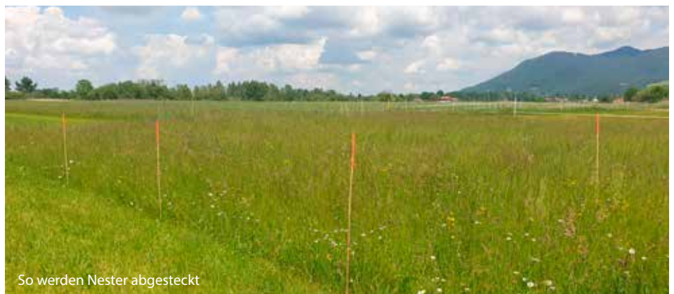
So werden Nester abgesteckt

15 Jungvögel von 16 Brutpaaren ergeben durchschnittlich einen nicht ausreichenden Bruterfolg pro Brutpaar. Zu berücksichtigen ist jedoch, dass die Nestersuche nicht mit einer gebietsabdeckenden Kartierung zu vergleichen ist. Festzuhalten ist jedoch: Diese Jungvögel hätten höchstwahrscheinlich ohne Betreuung nicht überlebt!