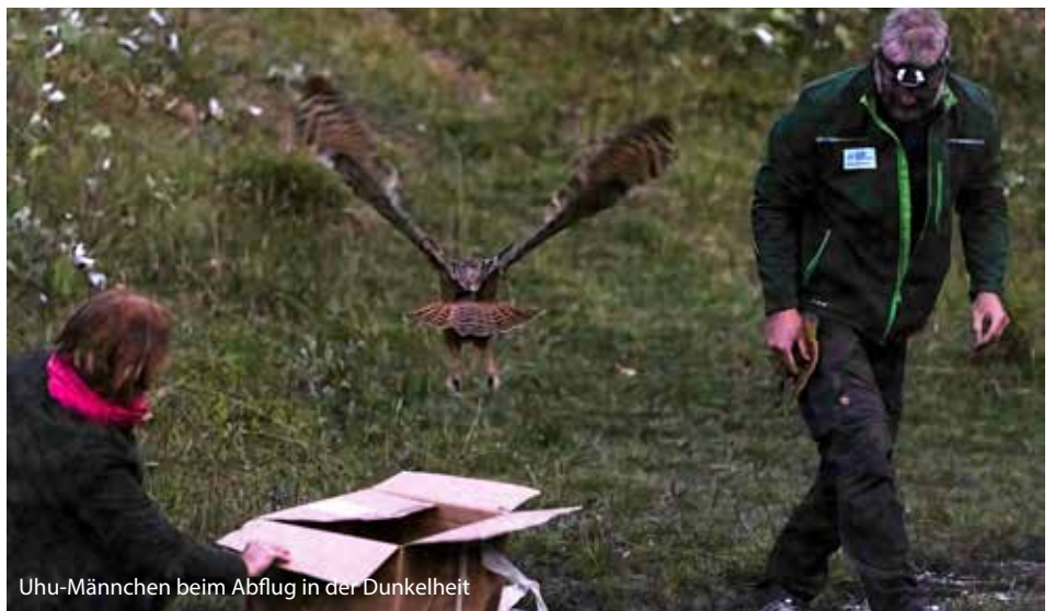
Uhu-Männchen beim Abflug in der Dunkelheit

Der Bruterfolg war dem der letzten Jahre vergleichbar: bei 11 beobachteten Revierpaaren konnten 6 Bruten nachgewiesen werden. 7 Vögel wurden flügge. Neue Reviere konnten nicht gefunden werden. Nach wie vor können wir die meisten Uhus im Süden von München beobachten, wo die Isar in einer relativ engen Schlucht zwischen Gemeinden mit vielen parkähnlichen Gärten fließt. Weiter südlich, wo sich das Tal weitet und die Landschaft landwirtschaftlicher geprägt ist, können wir weniger Brutpaare nachweisen. Woran das liegt, wissen wir nicht. Ob wir die Tiere nur nicht finden, ob es das Futterangebot oder die Landschaft ist – Hypothesen gibt es einige.