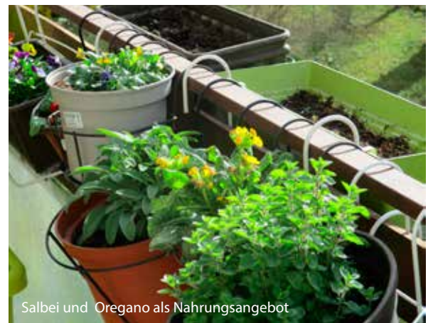
Salbei und Oregano als Nahrungsangebot