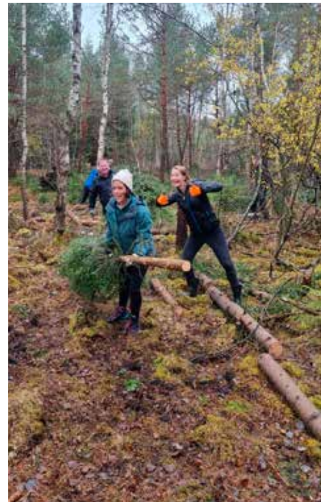
Mitarbeiter der Firma Astra Zeneka beim Stapeln von abgeschnittenen Ästen

VW wollte gleich mit 13 Mitarbeitern anrücken. Bei einer Führung durchs Königsdorfer Weidfilz sollte ihnen der Zusammenhang zwischen Klimaschutz und Moorschutz erklärt werden. Danach sollte ein Damm repariert und ein neuer gebaut werden. Leider wurde die Veranstaltung wegen der hohen Coronainzidenzen 2 Tage vorher abgesagt.