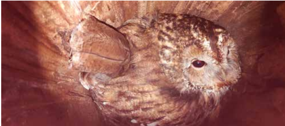
Der brütende Waldkauz durch das Einflugloch fotografiert.

Die Nistkästen im Eglinger Filz sind schon sehr alt, deshalb wollten wir sie dieses Jahr endlich abhängen.