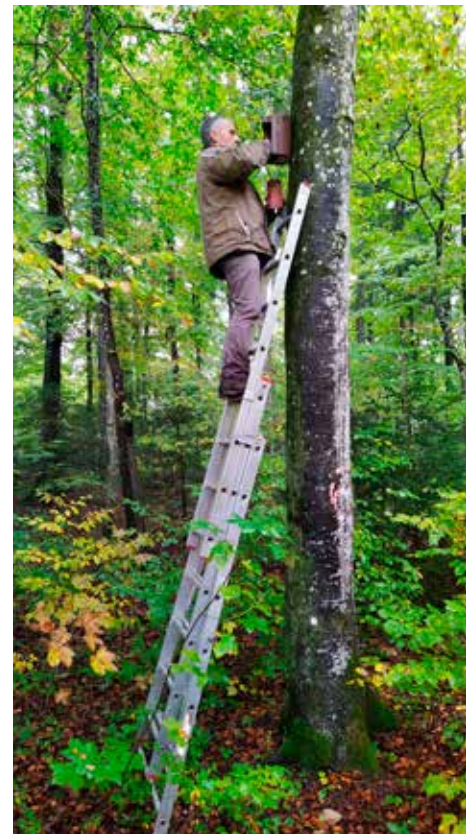
Nistkästen werden inspiziert und gereinigt.