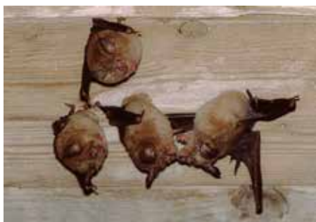
ANZAHL FLEDERMÄUSE BEI AUSFLUGZÄHLUNG