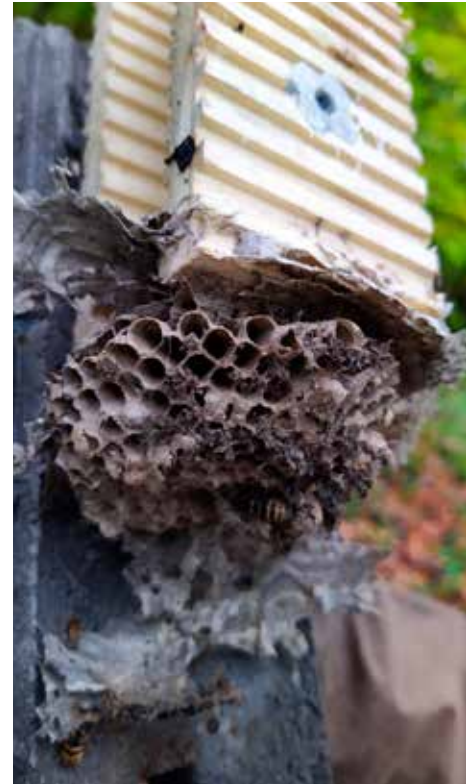
Hornissen im Fledermauskasten