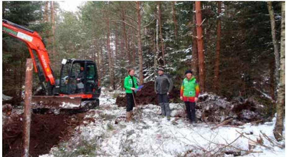
Mit einem moortauglichen Bagger startete das Projekt im Januar diesen Jahres

Das Zellbachtal ist auch herausragend wegen seiner Vielfältigkeit und dem kleinräumigen Wechsel an Lebensräumen mit Streuwiesen, naturnahem Zeller Bach, Hochmoor, Bachelwäldern und Moorwäldern. Um 1920 war das Bairawieser Moor weitgehend unbeeinflusst. Zu dieser Zeit konnte man – wie in vielen Mooren des Alpenvorlands – auf den weitgehend offenen Moorflächen noch Birkwild beobachten. Anschließend wurden im Hochmoor tief einschneidende Entwässerungsgräben gezogen und der Torf in Handtorfstichen gewonnen. Ein industrieller Torfabbau, wie in vielen größeren Mooren der Region, fand hier nicht statt. Nach Einstellung des Torfabbaus Mitte des 20. Jahrhunderts begann die Verbuschung und Aufforstung auf den entwässerten Moorstandorten. Das Hochmoor ist heute degradiert und im Wesentlichen mit Wald bestockt. Nur noch kleinflächig sind offene Hochmoorbereiche erhalten geblieben. Mächtige Torfauflagen von über 4 Metern und eingestreute Moorpflanzen, wie Torfmoose, Sonnentau und Rosmarinheide zeugen heute von dem ehemals offenen Hochmoor.