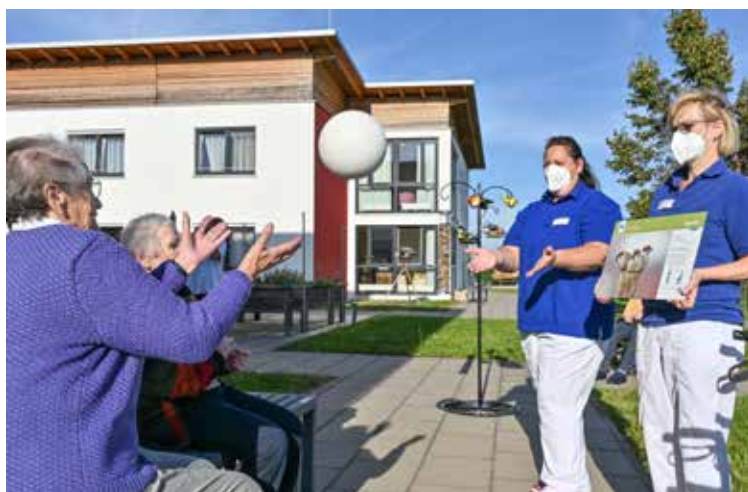
Neu ist der Stationenpfad „Heute geh'n wir bis zum Spatz“ - hier wird die Mobilität und die Koordination auch über verschiedenen Übungen gefördert; und nebenbei etwas zu den Vögeln gelernt.