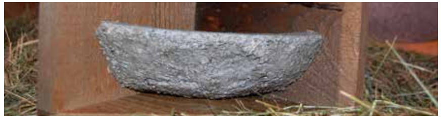
Rauchschwalbennest: offen, im Stall

Die ersten Nisthilfen wurden von den Schwalben auch schon angenommen und für die nächste Brutsaison würde ich mich über weitere Nachfragen sehr freuen.