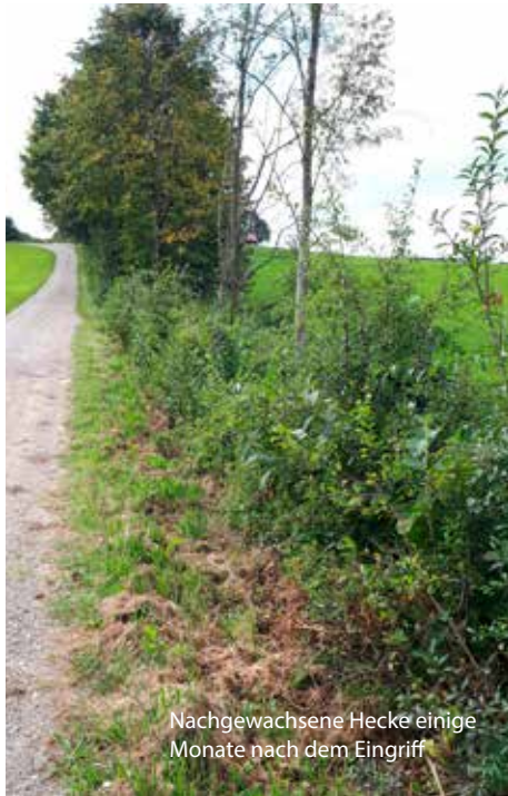
Nachgewachsene Hecke einige Monate nach dem Eingriff

R otkehlchen, Zaunkönig, Neuntöter und viele andere Vogelarten leben in Hecken. Sie bauen dort ihre Nester, fressen die Früchte der Sträucher, oder die Insekten, die dort leben. Ursprünglich als Windschutz oder früher auch als Weidebegrenzung gepflanzt, haben Hecken heute vielfältige ökologische Aufgaben. Damit sie diese erfüllen können, müssen sie gepflegt werden.