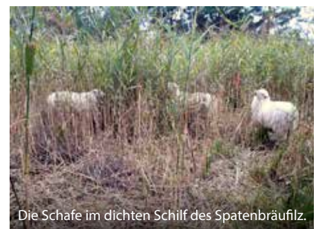
Die Schafe im dichten Schilf des Spatenbräufilz.