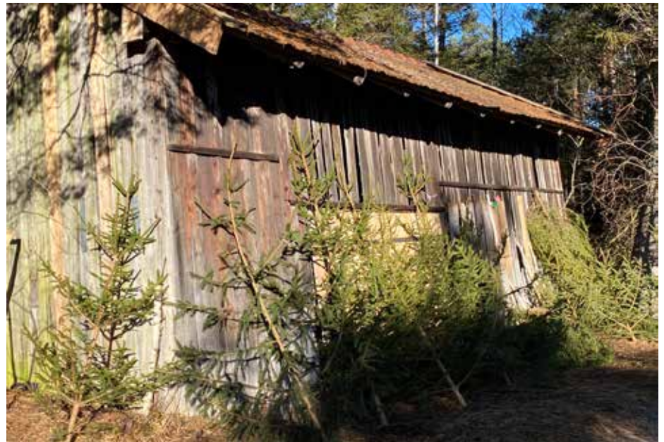
Die schöneren Bäume am Weg „gegen Spende abzugeben“