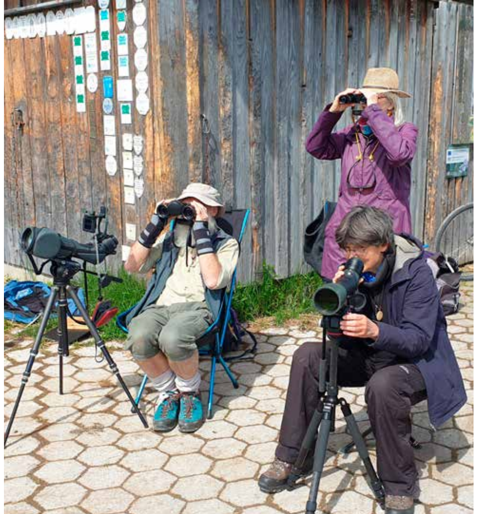
Bei der Zugvogel-Beobachtung BirdWatch im Loisach-Kochelsee-Moor

Alle Beobachtungen wurden auch in das Vogel-Erfassungssystem Ornitho.de eingegeben. Wir bedanken uns bei allen Teilnehmern und hoffen auf eine rege Beteiligung bei der nächsten BirdWatch-Aktion am 1./2. Oktober 2022