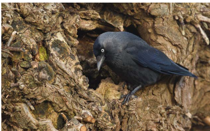
Rosl Roessner / LBV Bildarchiv

Dohle brüten natürlicher Weise in Baumhöhlen. Da sie gerne in Kolonien leben, brauchen sie mehrere geeignete Bäume beieinander. In unseren Forsten finden sie nur wenige dicke Bäume mit Höhlen ausreichender Größe. Deshalb brüten die meisten Dohlen in Kirchen und anderen Gebäuden. Durch das Anbringen von Nistkästen im Turm, kann eine Verschmutzung des Turminnenraums verhindert werden.