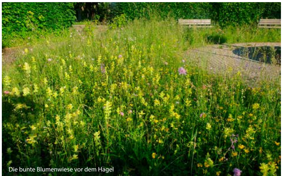
Die bunte Blumenwiese vor dem Hagel

Nun zur Wiese selbst: Wiesensalbei, Echtes Labkraut, Moschusmalve, Kleines Mädesüß, Beifuß, Acker-Witwenblume, Scabiosen-Flo-