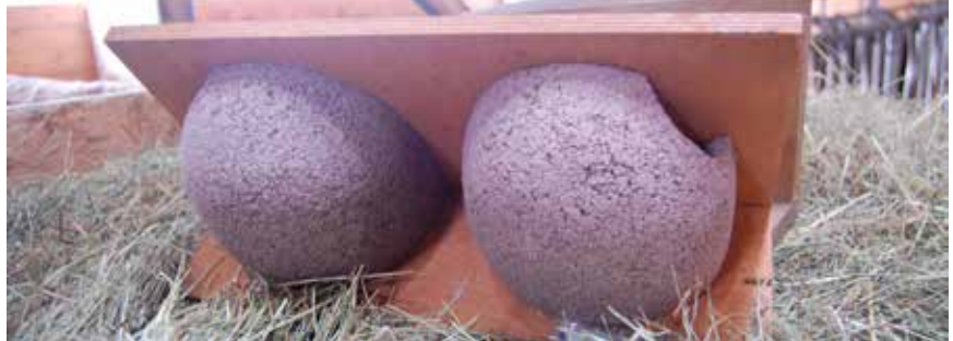
Mehlschwalbennest: geschlossen, außen am Stall