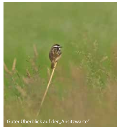
Guter Überblick auf der „Ansitzwarte“

nicht wegfliegen können und einen gewissen Radius um das Nest beanspruchen.