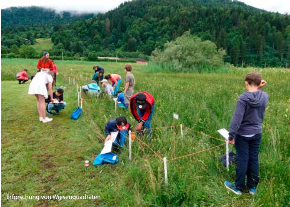
Erforschung von Wiesenquadraten

Hinter dieser Überschrift verbirgt sich ein großes Umweltbildungsprojekt, das die LBV-Bezirksgeschäftsstelle Oberbayern im Frühjahr 2021 startete.