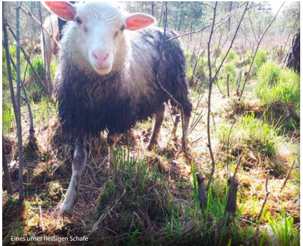
Eines unser fleißigen Schafe

Die neue Koppel erwies sich wegen ihres teils dichten Fichtenaufwuchses als segensreich: Während man nach dem Hagelunwetter in der Zeitung von einem erschlagenen Schaf lesen konnte, waren unsere Tiere auch ohne Stall nur nass aber unverletzt. Sie hatten sich in die Dichtung zurückgezogen. Da in den folgenden Wochen teils täglich weiterer Hagel angekün-