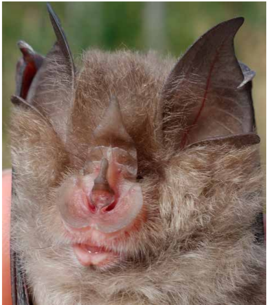
Die bedrohte Fledermausart: die Kleine Hufeisennase