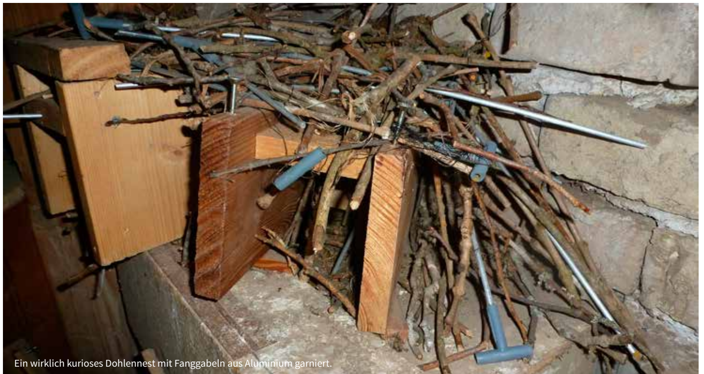
Ein wirklich kurioses Dohlennest mit Fanggabeln aus Aluminium garniert.

zur Eiablage, die Brut war nicht erfolgreich. Dohlennester können von Kolonie zu Kolonie unterschiedlich sein. So reicht die Palette von höchst ordentlich gebauten Nestern aus Reisig und Moos bis hin zu "Schlampennestern", die mehr einer Müllkippe ähneln.