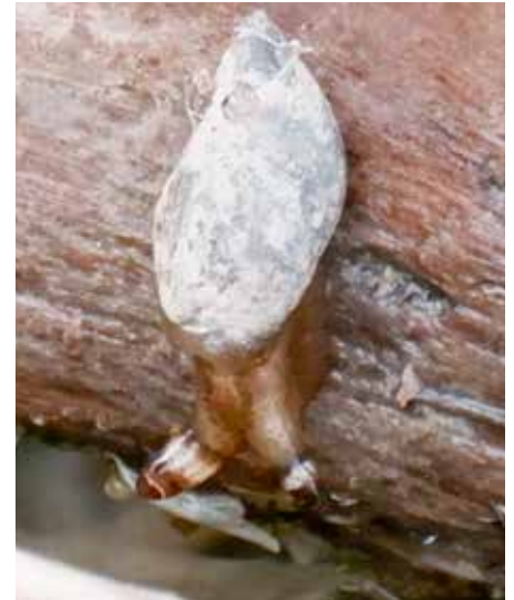
Bernsteinschnecke mit Plattwurmbefall

schenwirt genutzt wird. Die Sporocysten-schläuche der Würmer schieben sich in die Fühler der Schnecke und bewegen sich dort rhythmisch. Durch Farbe und Bewegung lo-