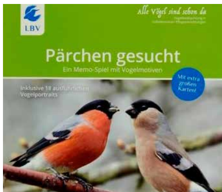
Das LBV-Memospiel „Pärchen gesucht“

Alle Vögel sind schon da - mit diesem Logo sind schon viele Produkte entstanden. Einige wie das Dalli-Klick-Aufdeckspiel oder ein Praxisordner mit Beschäftigungs-Ideen für Betreuungsfachkräfte nur für die am Projekt beteiligten Einrichtungen, aber zwei Produkte sind mittlerweile auch im LBV-Shop erhältlich. An dem Vogelbuch für Einsteiger oder dem Memospiel mit extragroßen Karten und kontrastreichen Bildmotiven aus der heimischen Vogelwelt haben nicht nur ältere Menschen große Freude.