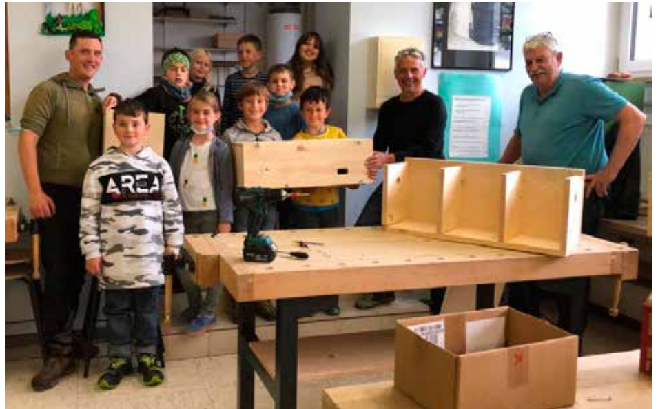
Die Schüler der Grundschule in Reichersbeuern sind mit Begeisterung dabei!

Sie sollen nicht nur die kleine Spatzenkolonie erweitern, die ihre Brutnischen auf der Ostseite der Gesamtschule Wolfratshausen hat, während die zehn Nistkästen auf der Westseite seit vielen Jahren erfolgreich von Mauerseglern besiedelt werden und auch in diesem Jahr wieder vollständig besetzt waren. Ab 2024 könnte die Aufstockung des östlichen Schultrakts beginnen, wovon die Nistplätze der Hausspatzen betroffen wären. Im Hinblick auf die gebäudebrütenden Vögel wie auf möglicherweise dort vorkommende Fledermäuse haben wir der Stadtverwaltung unsere Mithilfe bei der artenschutzrechtlichen Prüfung bereits zugesagt. Mit zusätzlichen Nistkästen am Steghiaslweg sollen den Spatzen beizeiten schon Ausweichquartiere geschaffen werden.